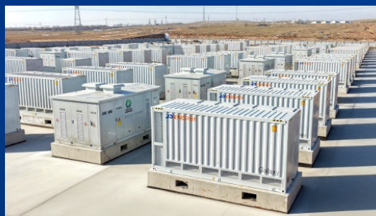
宁夏瀚骏150MW/600MWh储能项目 ——奇点能源组串式预制舱于宁夏成功应用