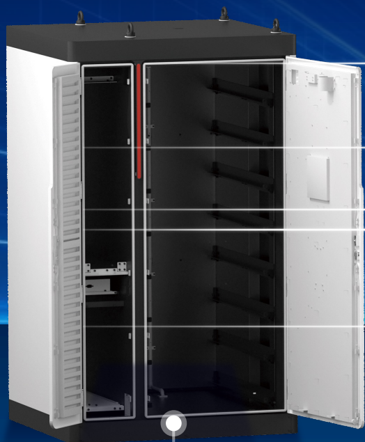
All in One

这一设计直接推动储能解决方案由复杂的工程项目向便捷的产品形态转化，显著降低了安装与运维成本，加速了市场应用与普及步伐。