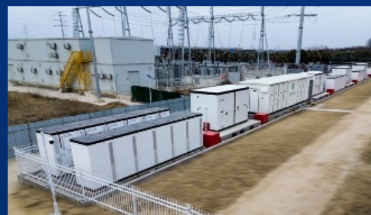
通威盐城10MW/20MWh储能项目 ——黄海之滨，滩涂之上；储蓄盐城无限风光