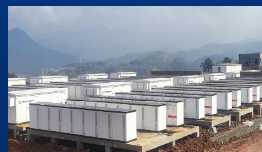
震东100MW/200MWh电化学储能项目 ——山颠克难 树立巴蜀储能项目标杆