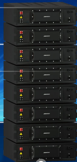
高效均衡BMS 长寿命电芯