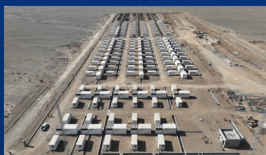
甘肃酒泉450MW/900MWh储能电站 ——打造源网荷储一体化示范储能项目