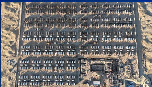
内蒙古磴口 500MW/2000MWh 储能电站 ——奇点能源首个GWh级储能项目