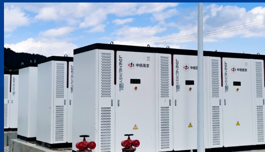
中核临翔200MW/400MWh储能电站 ——滇西群山中的“能量方舟”