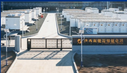
津西新能源60MW/120MWh用户侧储能项目 ——大国钢铁+储能 华北最大分布式模块化用户侧储能项目