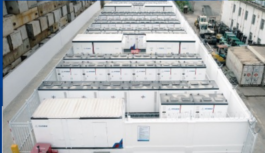
深圳赤湾16 MW/60 MWh储能示范项目 ——35天极速交付 广东省最大分布式模块化用户侧储能项目