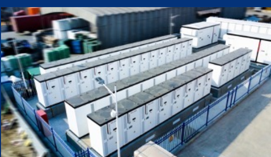
合肥TCL家用电器10MW/20MWh储能电站 ——为家电制造行业“智造之躯”注入绿色脉搏