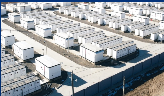
宁夏牛首山200MW/400MWh储能电站 ——全球最大的电网侧分布式模块化储能电站项目