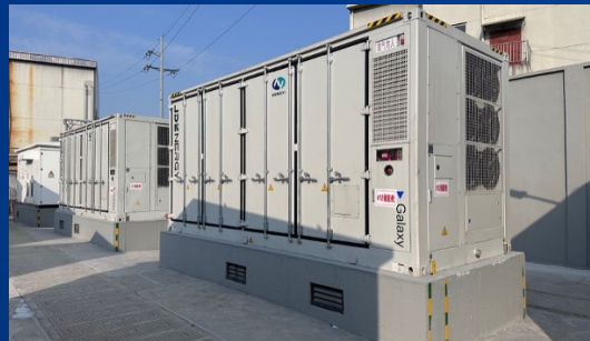
恒逸石化33.5MW/67MWh储能项目 ——奇点能源交付的浙江最大单体工商业储能项目