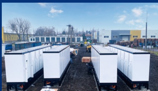
匈牙利6MW/12MWh工商业储能项目 ——奇点能源首个海外工商业储能项目