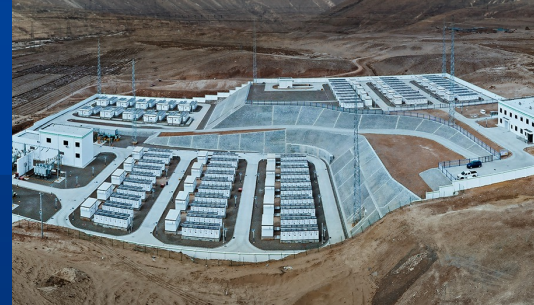
宁夏华严变200MW/400MWh储能电站 ——全球最大的电网侧分布式模块化储能电站项目