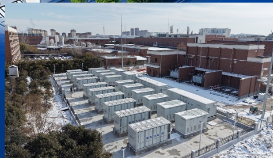
江苏淮安25MW/50MWh工商业储能项目 ——奇点能源交付的江苏最大单体工商业储能项目