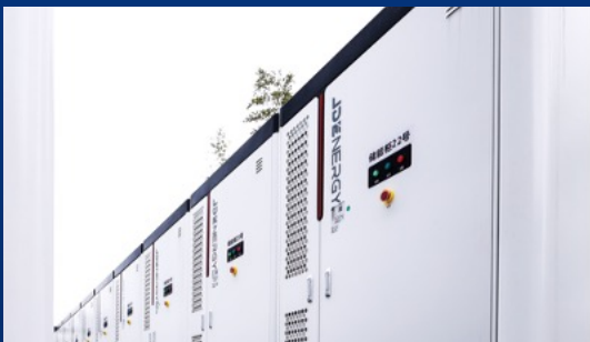
浙江锦盛控股集团11MW/22MWh储能项目 ——纺织+储能，华东最大分布式模块化用户侧储能项目