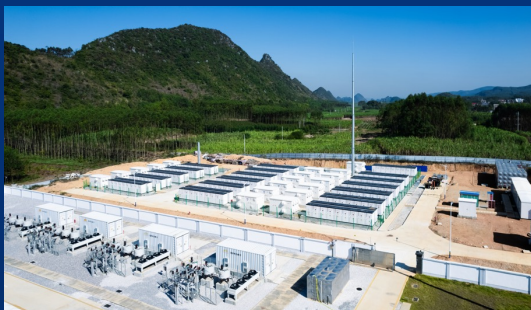
广西贵港144MW/288MWh储能电站 ——城市“能源绿肺” 保障西南地区能源稳定供应