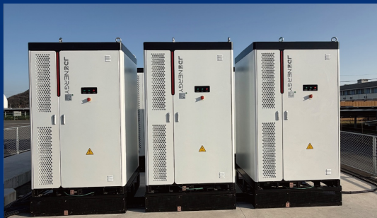
日本1.29MW/2.508 MWh用户侧储能项目 ——日本首个工商业储能项目、优化负荷、降本减碳