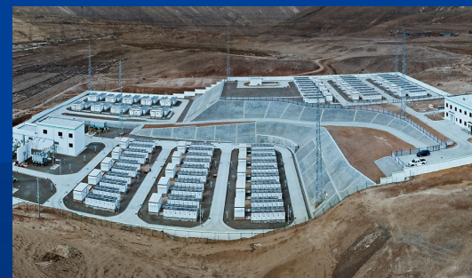
宁夏华严变200MW/400MWh储能电站 ——全球最大的电网侧分布式模块化储能电站项目