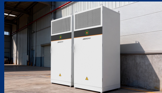
意大利0.1MW/0.24 MWh用户侧储能项目 ——守护岛屿电网柔性的关键支撑