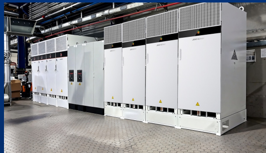
德国2MW/4MWh用户侧储能项目 ——奇点能源首个德国用户侧储能项目