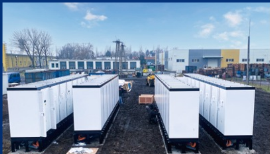
匈牙利6MW/12MWh工商业储能项目 ——奇点能源首个海外工商业储能项目